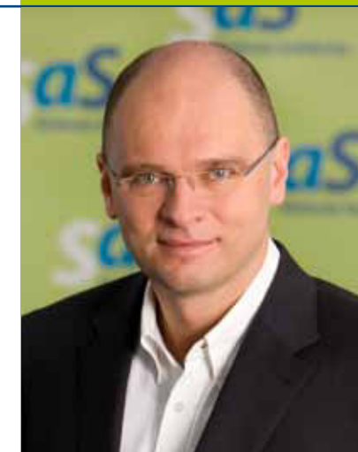
Richard Sulík predseda strany SaS

Pozrite si prosím aj naše mzdové koliesko, ktoré je priložené k tomuto programu. Ľahko zistíte, o koľko stúpne čistý mesačný príjem Vašej rodiny po zavedení Odvodového bonusu. A 12. júna nezabudnite prosím ísť voliť.